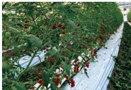
2019年9月27日 ミニトマト まばらな結実