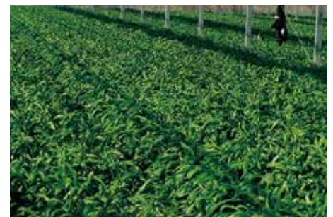
2020年3月 森のめぐみ 施肥