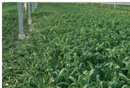
2020年2月15日 壬生菜 成長にばらつきが見られる