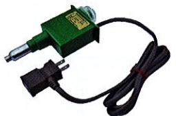
④ グリーンサーモ 12F