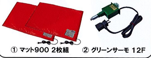
① マット900 2枚組 ② グリーンサーモ 12F

① マット900 品番: MT-20 ・ 定格仕様: AC100V・85W (加温用) ・ サイズ: 長さ900×幅600×厚み10 (mm) ・ 材質: 塩化ビニール