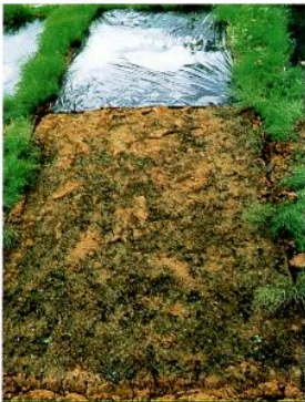
『暖』あったかマルチ