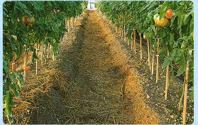
▲うね間 (通路) 散粒