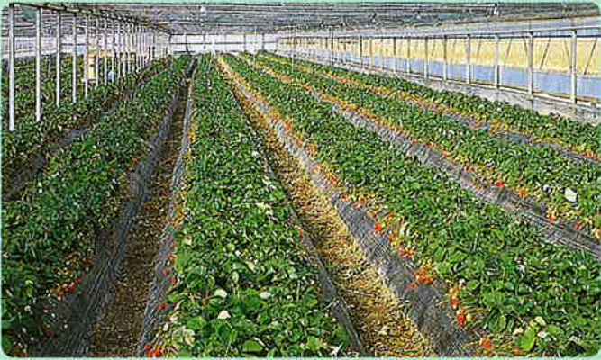
▲株元散粒 (灌水チューブの下)