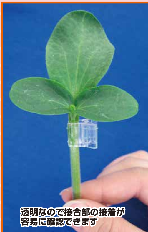
透明なので接合部の接着が 容易に確認できます