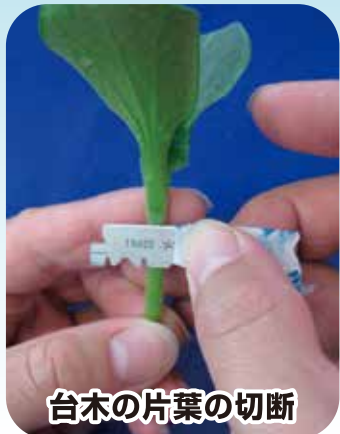
台木の片葉の切断