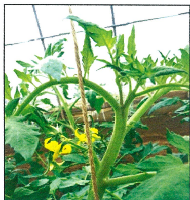
トマト芯どまりメガネ